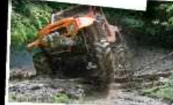
CROATIA TROPHY 2011