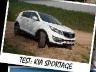
TEST: KIA SPORTAGE